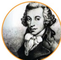
Ignace Pleyel (1757-1831)