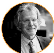
Paolo Fazioli (1944)