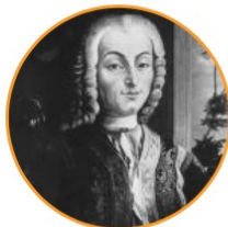
Bartolomeo Cristofori (1655-1731)