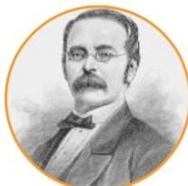
Heinrich Steinweg (1797-1871)