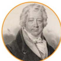
Sébastien Érard (1752-1831)